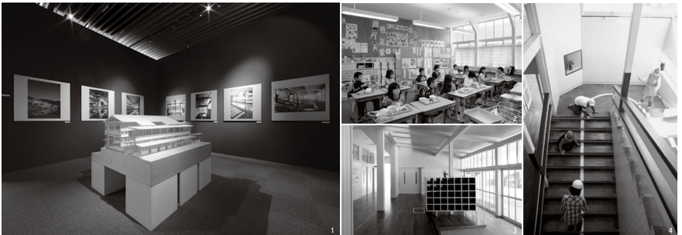
1 Gallery A*(東京)展示風景 2 教室内の風景 3 昇降口(増築部分) 4 階段

戦後木造建築であるモダニズム建築の文化財的価値を維持しつつ、高度な教育施設としての機能も保持しつづけるという課題が、今回の修復工事の枠組みを構成していた。こうした課題はわが国の建築修復事例においてははじめてのものである。戦後木造建築として初の重要文化財建造物の指定を目指した本工事がもたらすものが、わが国の文化財建造物保存修復事業に新しい可能性を示すことを願っている。